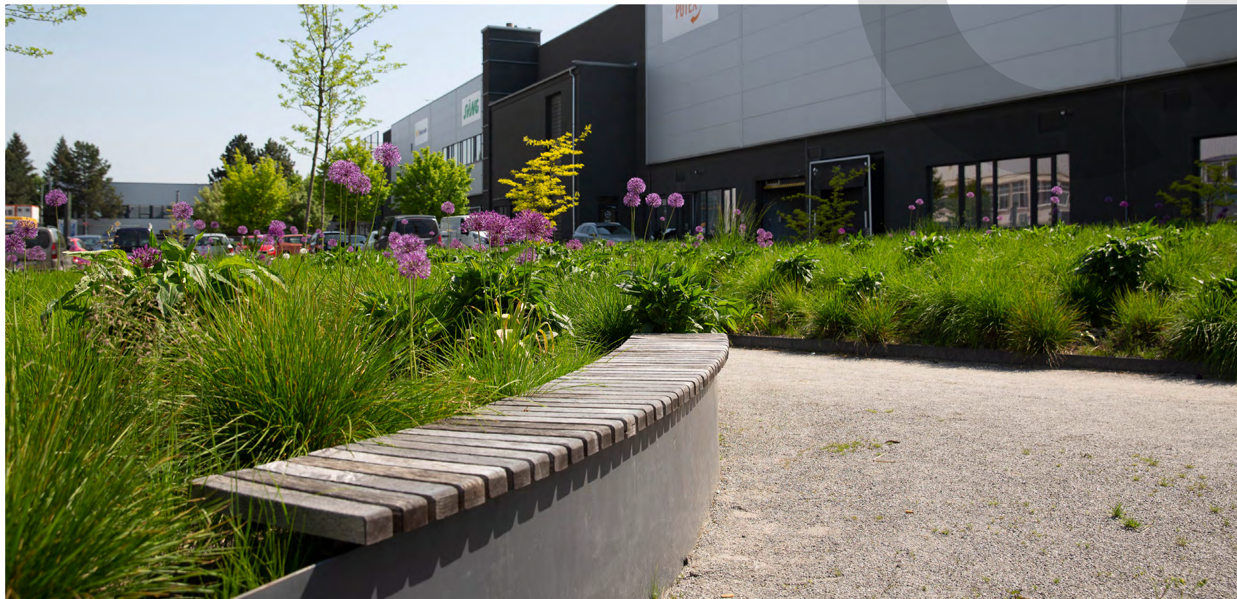
Contera Park Říčany