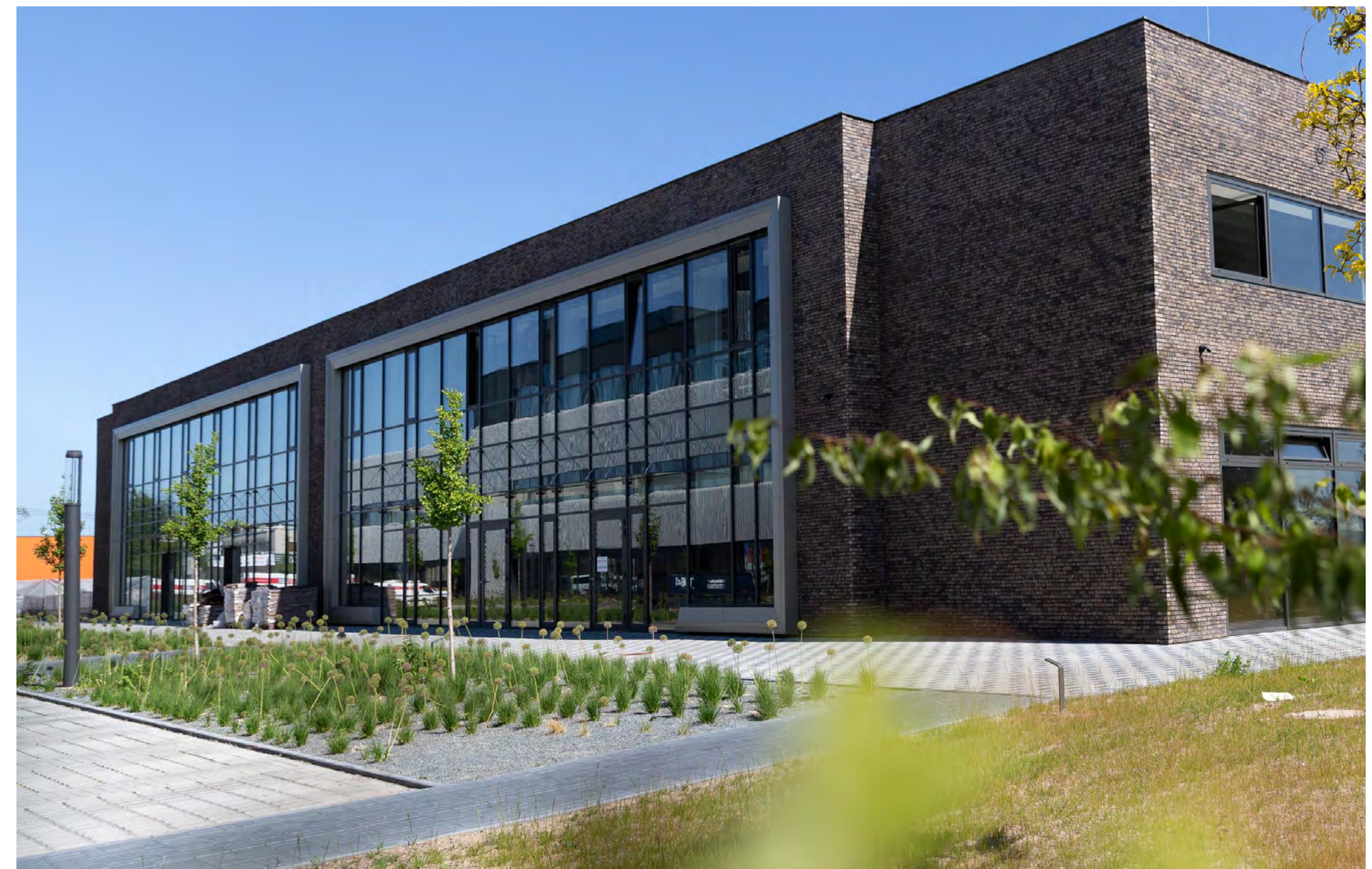
TERRA, Contera Park Říčany