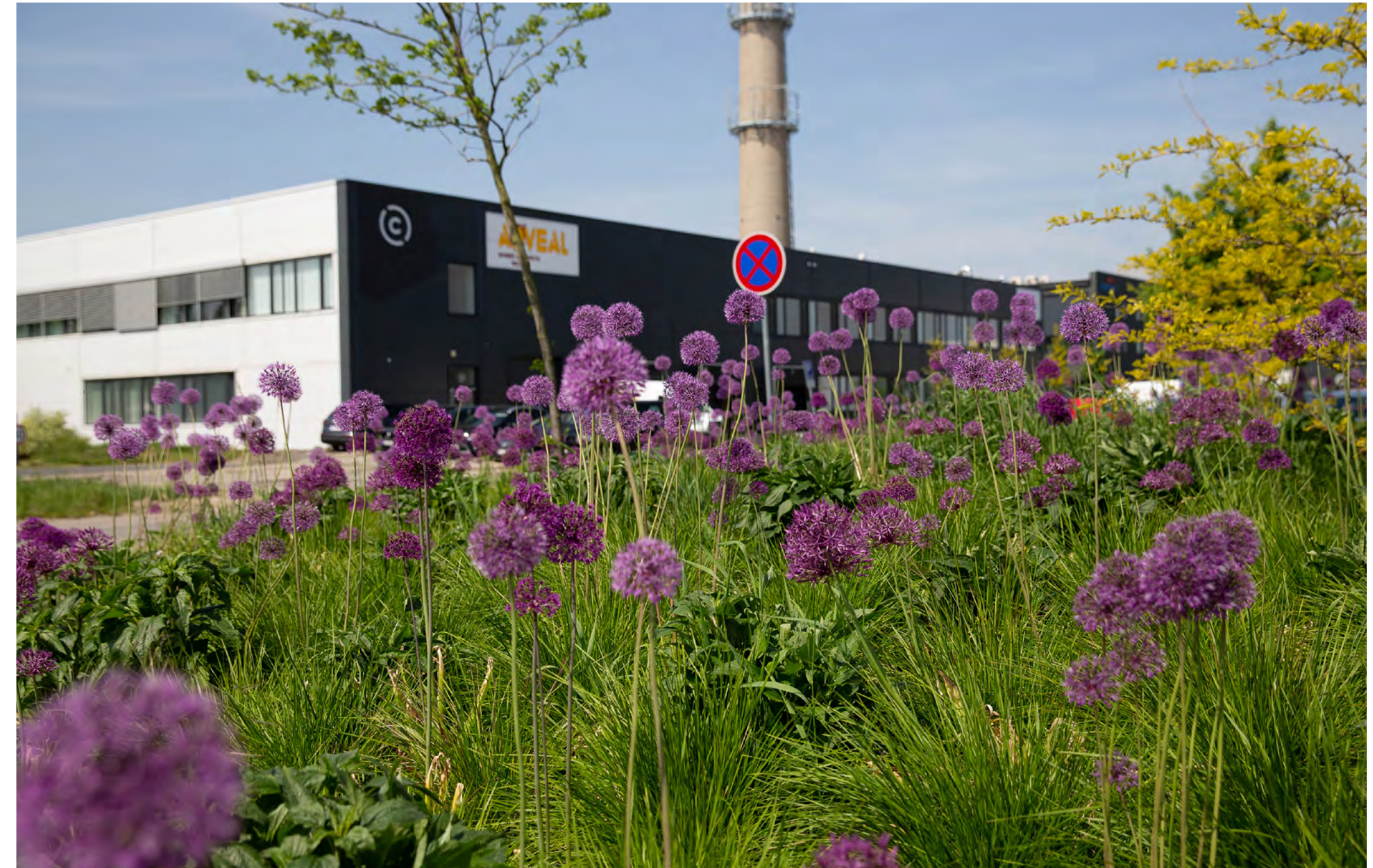
Contera Park Říčany