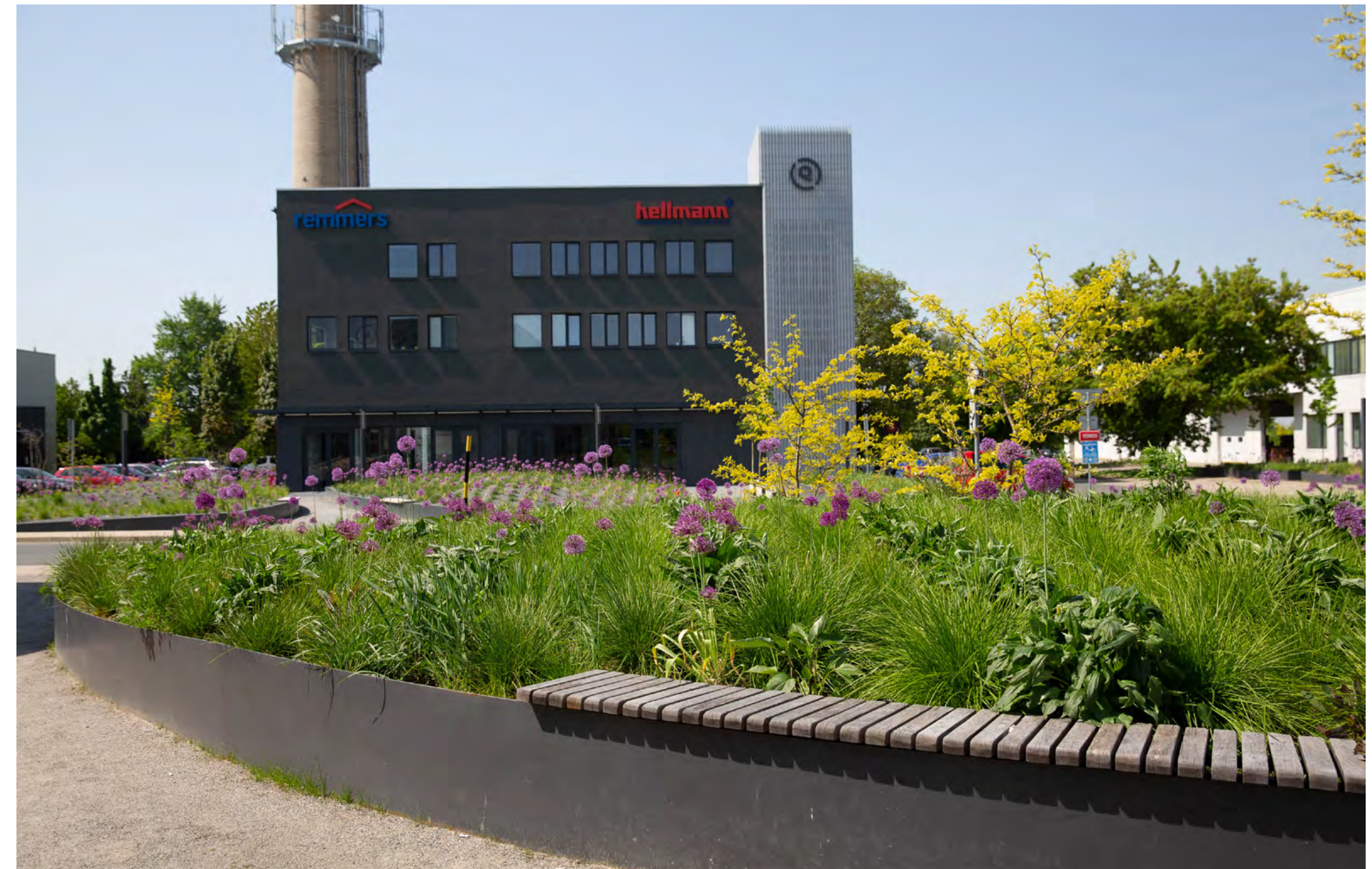
Contera Park Říčany