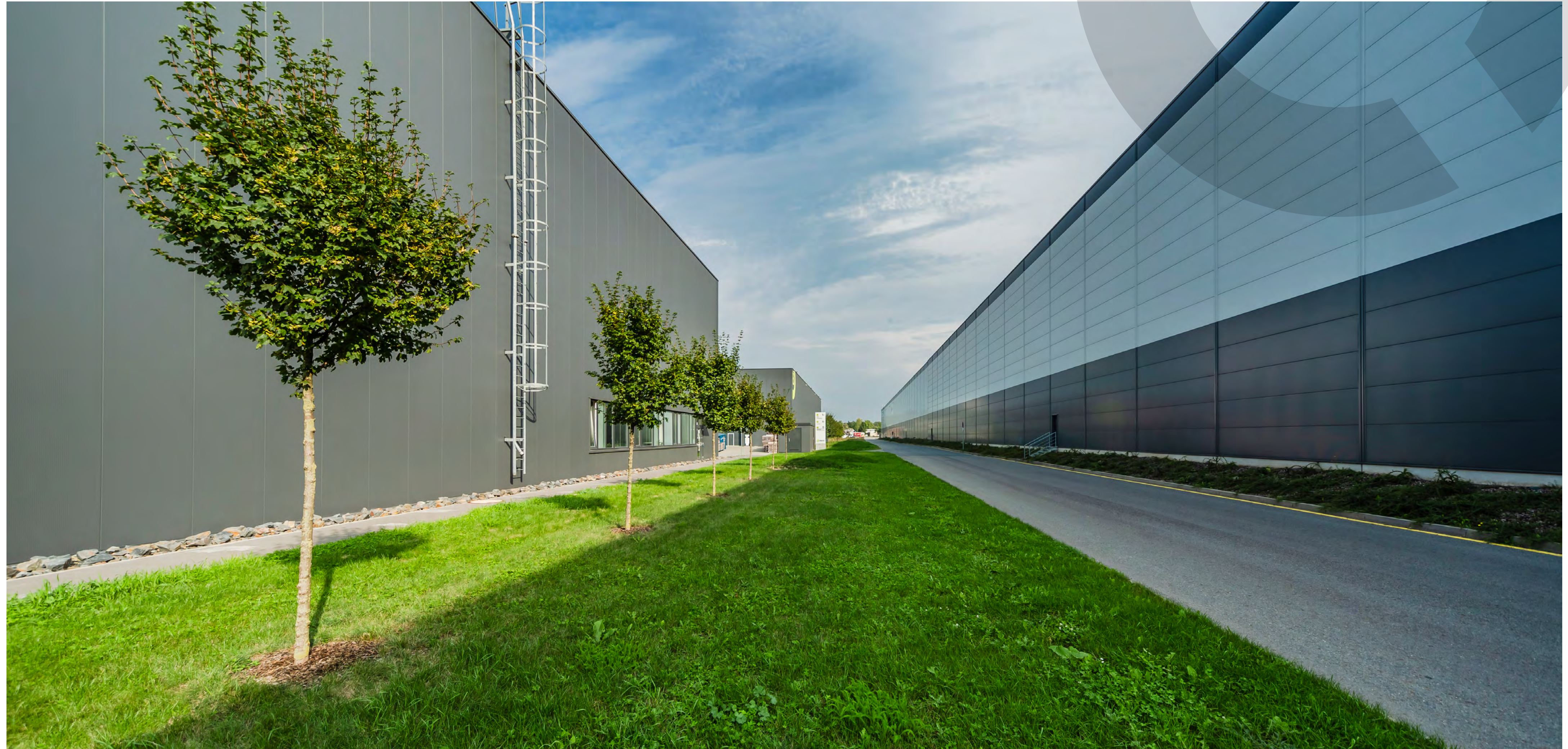
Contera Park Ostrava City